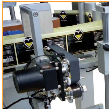
Hot foil coding unit Codificatore a caldo

Labelx® JR 250 Cadenzatore prodotti Gruppi di sovrastampa a trasferimento termico, a caldo, a secco e thermal inkjet Encoder per sincronizzazione velocità erogazione etichetta con velocità della linea di trasporto Struttura principale e quadro elettrico in acciaio inox AISI 304