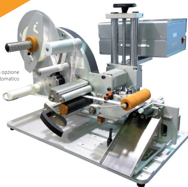
Versione con opzione scarico automatico

Presvolgitore meccanico Fotocellula stop standard Posizionatore prodotti a rulli motorizzati Base di sostegno da tavolo Gruppo regolazione micrometrica Rullo applicatore con sensore di start