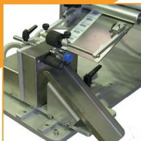
Scarico automatico prodotto