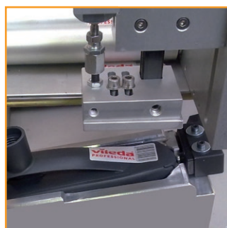
Posizionatore per prodotti irregolari