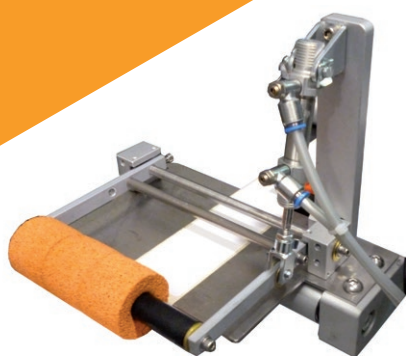
Rullo applicatore pneumatico

Presvolgitore meccanico Fotocellula stop standard Posizionatore prodotti a rulli motorizzati Base di sostegno da tavolo Gruppo regolazione micrometrica Rullo applicatore con sensore di start