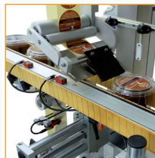
COMPACT TB-L conveyor module COMPACT TB-L modulo di trasporto

N. 2 Labelx® JR 140 - Regolazioni meccaniche orizzontale e verticale per il posizionamento delle etichettatrici - Struttura principale e quadro elettrico in acciaio verniciato - N. 2 Nastri di trasporto piani (versione TB-P) - N. 2 Nastri di trasporto laterali (versione TB-L) - Pannello operatore HMI touch da 7" e 256 colori - Connessione Ethernet e Industria 5.0 ready.