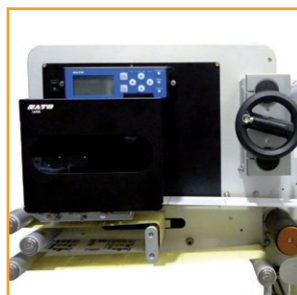
Stampante a trasferimento termico